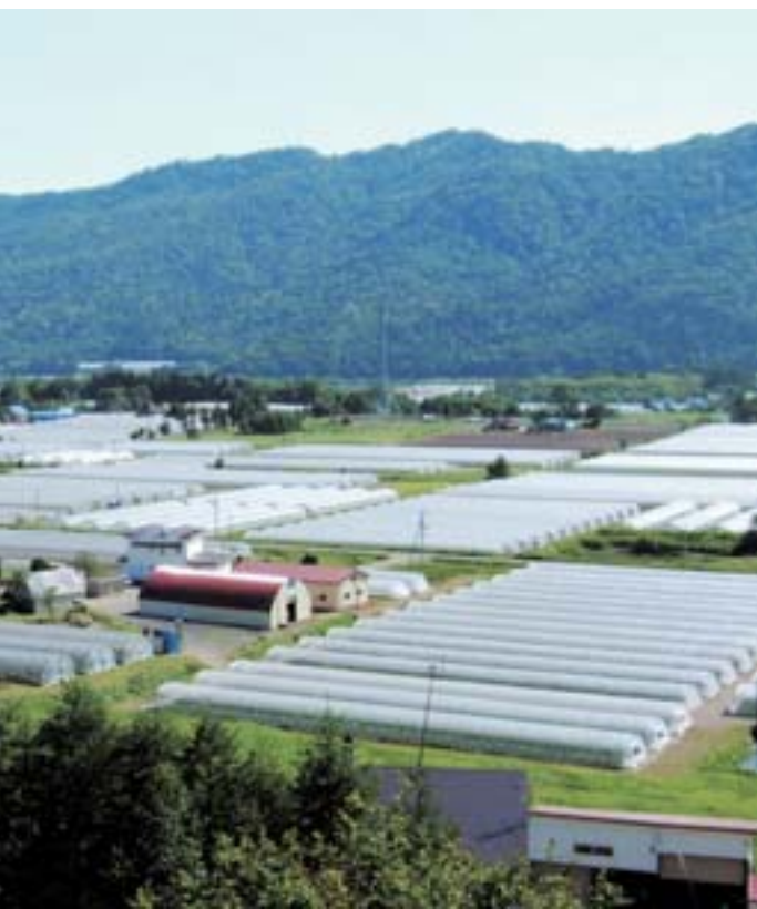
切詩。広がるメロンハウス