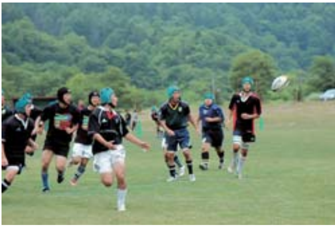
全国9ブロックに分けた選抜チーム選手396名が参加した「全国高校ラグビー大会」が21日から3日間、平和運動公園で開かれた。