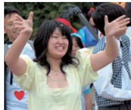
「夕高快晴 青い空 ~愛は夕張を救う 再 2007」をテーマに7月14日から3日間、夕張高校祭が開かれ、初日は仮装パレードが行われ