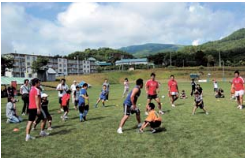
7月22日「親子ラグビー教室」が平和運動公園で開かれコベルコスティーラーズの平尾誠二総監督や元木由記雄選手らがちびっ子ラグーを指導した。