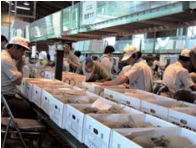
厳しい品質チェックで合格したものだけが全国へ。