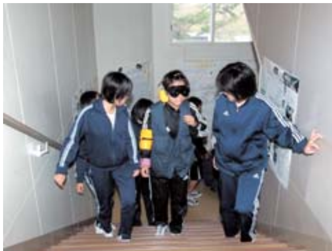
福祉に理解を深めてもらうための「福祉体験講座」が7月13日緑陽中学校で行われた。視野を狭くしたゴーグル、おもり入りのベスト、腕と足を固定した装具をつけ、友人の手を借りて、階段を上り下りし障がいがある人の気持ちになって考え行動することを学んだ。