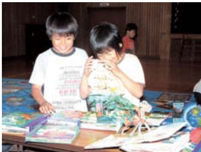
本に親しんでもらおうと、道立図書館による読書支援活動が7月9日から11日まで行われた。本を開くと飛び出してくる立体型の仕掛け絵本もあり児童から歓声があがっていた。(緑小学校)