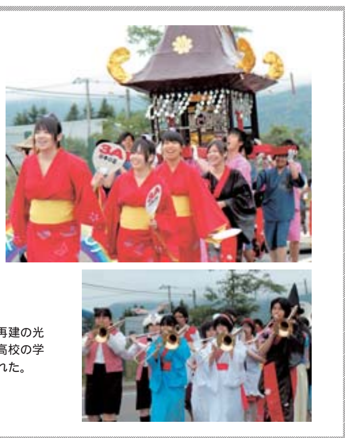
再建の光 高校の学 れた。