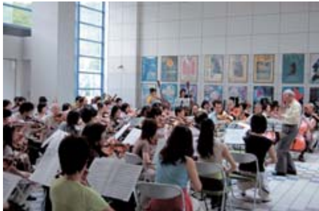
全国各地から演奏家が集まり、夕張市民吹奏楽団と合同で「夕張メロンオーケストラ」を編成し、公開練習とコンサートをホテルマウントレースイで7月14日から16日まで行われた。