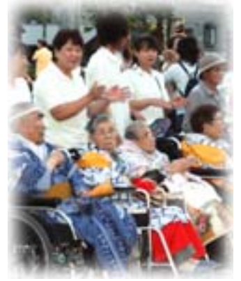
●子どもたちの健全な育成に関する事業