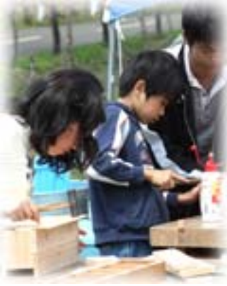
●歴史的に貴重な炭鉱遺産の伝承と保全に関する事業