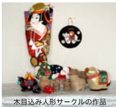
木目込み人形サークルの作品