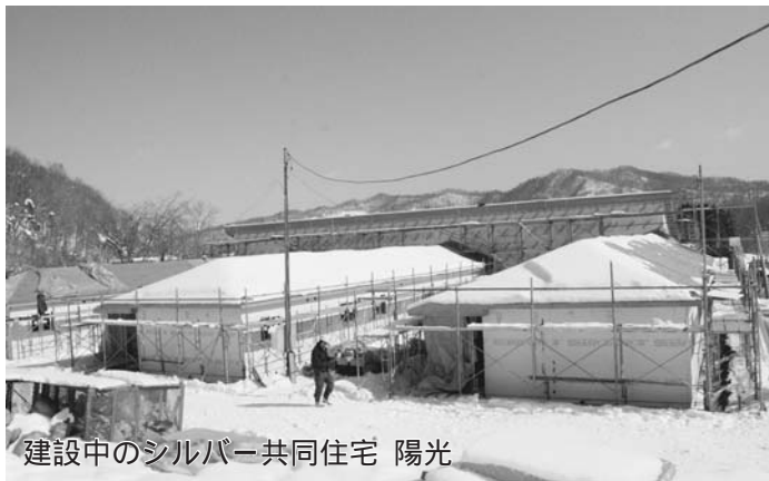
建設中のシルバー共同住宅 陽光

市から譲渡された3棟の住宅を18戸に改修します。「三」の字のようになっているものを「ヨ」の字のようにして、縦を新築して、共同スペースを設けることにしました。